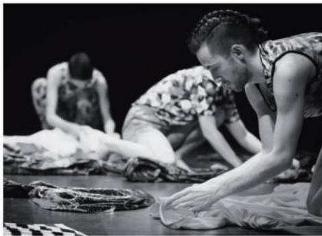
Convoquant l'art de l'absurde, Wouah! invite à observer les situations qui s'enchaînent sur le plateau de théâtre.