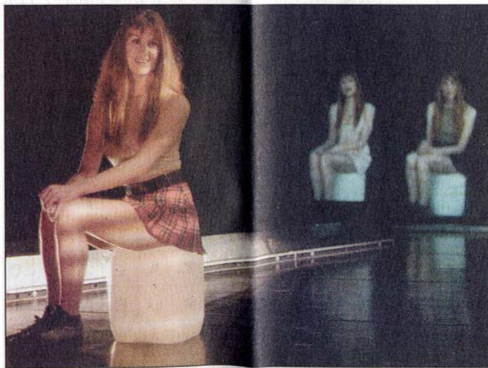
«Madame K» se révèle d'une surprenante pertinence sur les interférences entre l'image et le corps.